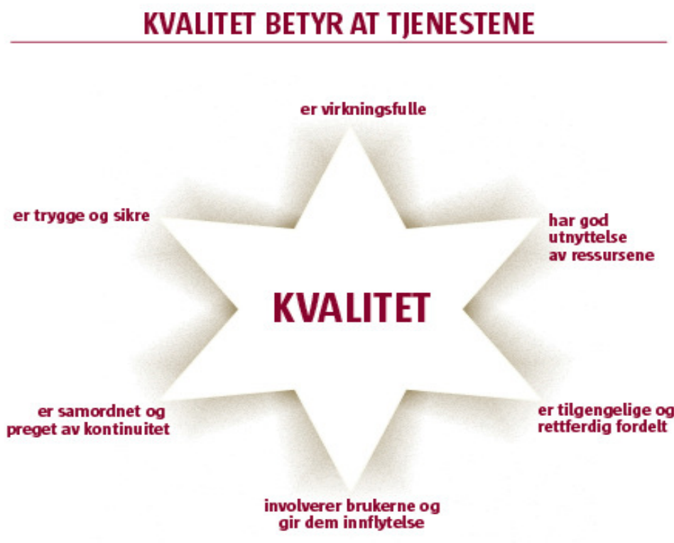
Figur 1. Kvalitetsstjerne basert på Nasjonal strategi for kvalitetsforbedring, ”..og bedre Skal det bli”. God kvalitet forutsetter at brukerens erfaringer og synspunkter påvirker tjenestene.

Strategi for brukermedvirkning i Helse Midt-Norge beskriver den overordnede retningen for brukermedvirkning i vår region. Strategien presenterer mål, satsningsområder og overordnede tiltak som må iverksettes for å sikre at brukermedvirkning styrkes og integreres i spesialisthelsetjenestens virksomhet for å øke kvalitet i tjenestene som spesialisthelsetjenesten i vår region yter.