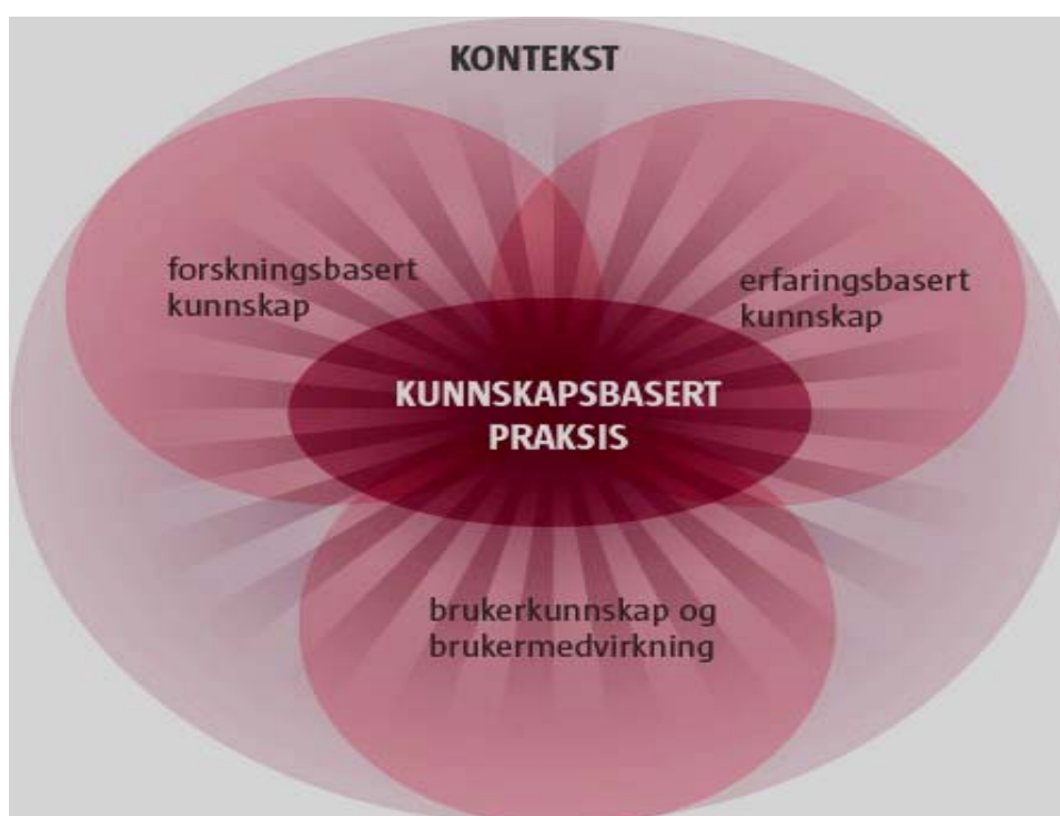
Figur 2: Kunnskapsbasert praksis. Brukermedvirkning er et av de sentrale elementene i kunnskapsbasert praksis som spesialisthelsetjenesten skal baseres på. 2

Handlingsplan for brukermedvirkning i Helse Midt-Norge er delt i tre deler: